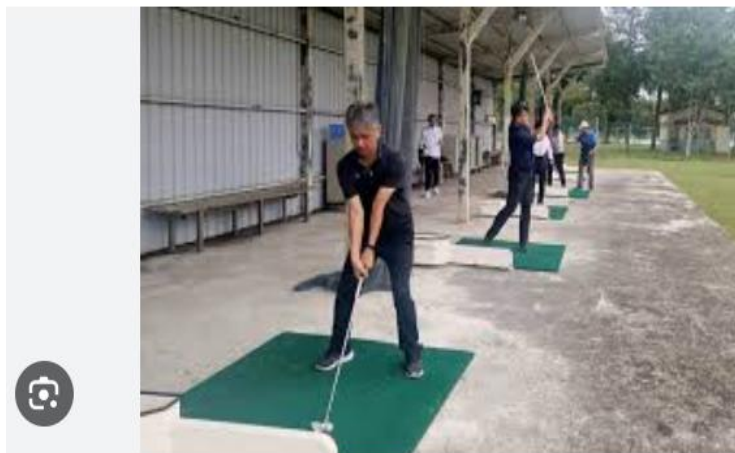
東華大學辦理國中體健輔導團高空探索與高爾夫體驗課程- 聚焦花蓮新聞